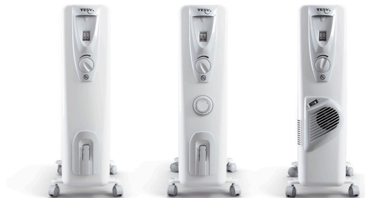
■> E01 R